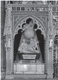
ウェストミンスター寺院 内のニュートンの墓

ニュートンは1643年生まれで、1727年に84歳で亡くなっている。生涯独身であった。残っている肖像画 (painted portrait) を見るとどこことなく神経質そうな感じが漂っているが、それは天才大科学者ゆえにそう見えるのかもかもしれない。